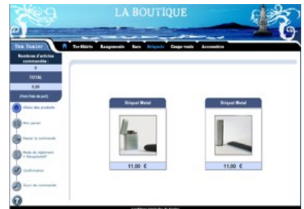
Menu d'administration de la Boutique

Grâce à votre site marchand, les internautes auront la possibilité de consulter votre catalogue, de sélectionner des produits, de les commander et de les payer en ligne. Une fois le paiement effectué, les commandes vous seront envoyées par e-mail ou accessibles par l'intermédiaire d'une interface de gestion. Nous vous proposons des modules d'administration simple qui vous permettront de faire évoluer votre site rapidement et sans intervention technique, comme et quand vous le voulez.